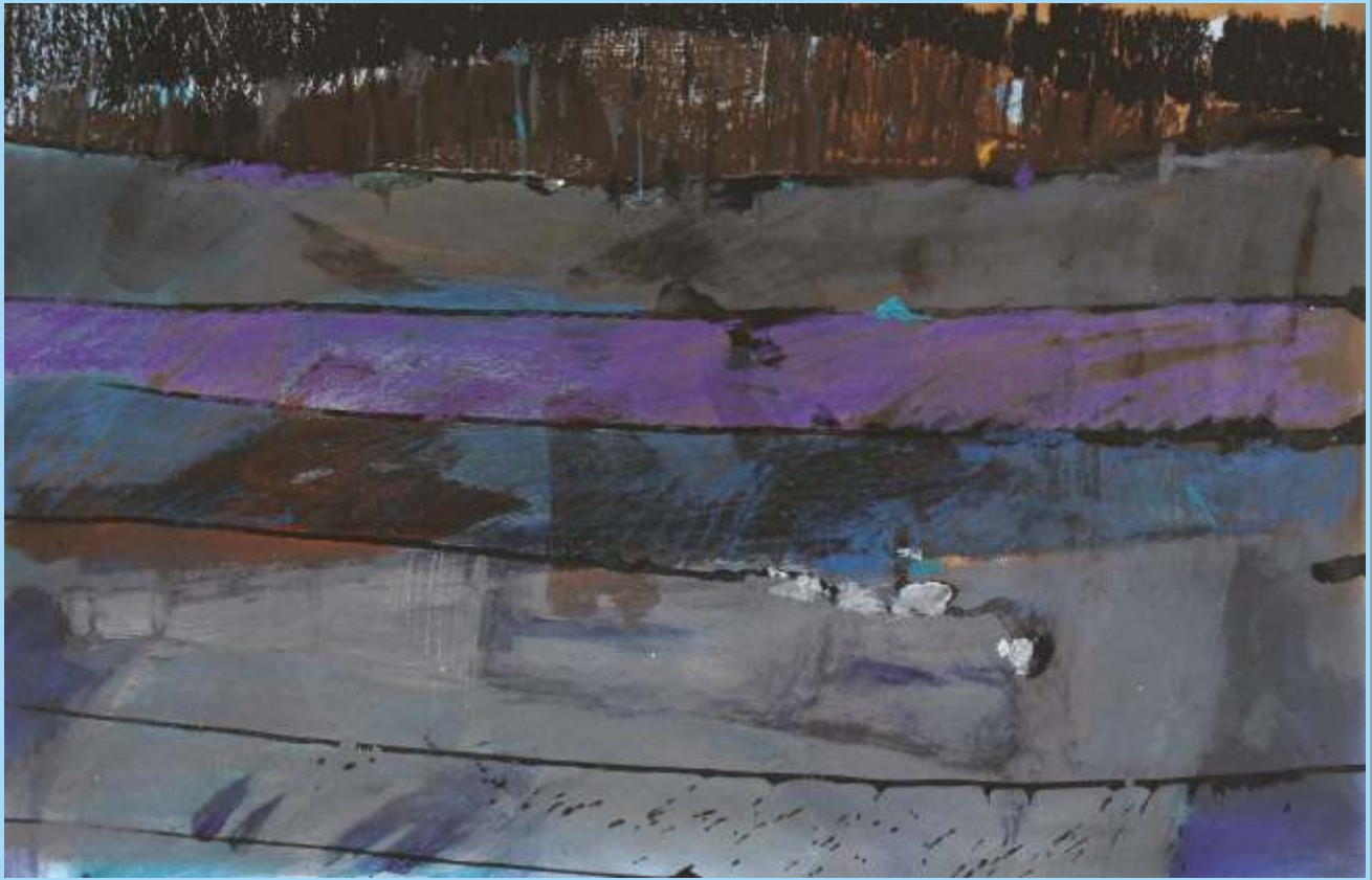
Andrzej Gutfeld Malarstwo