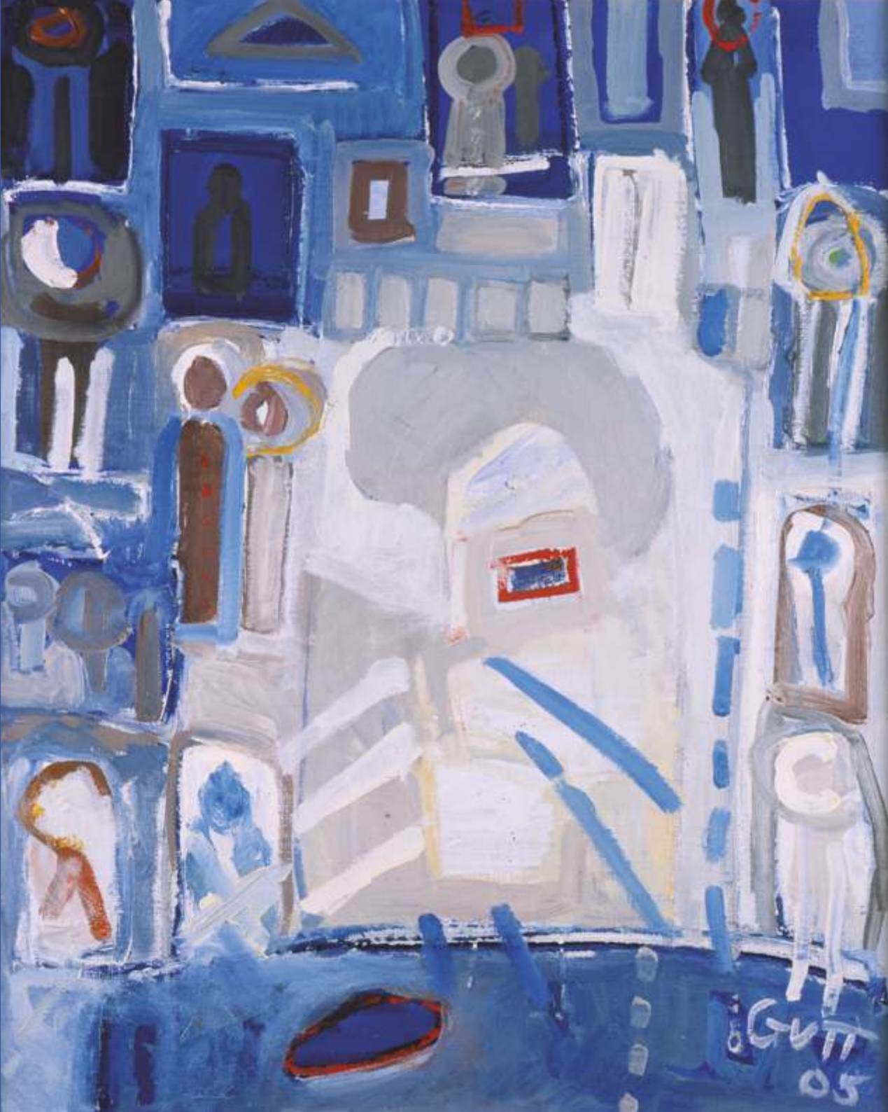
Ikonostas, olej, 100 cm x 70 cm