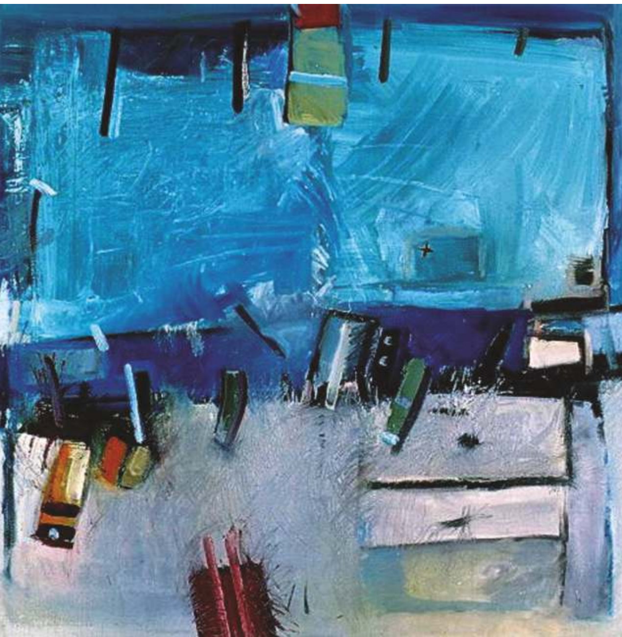
Martwa natura , olej, 120 cm x 120 cm