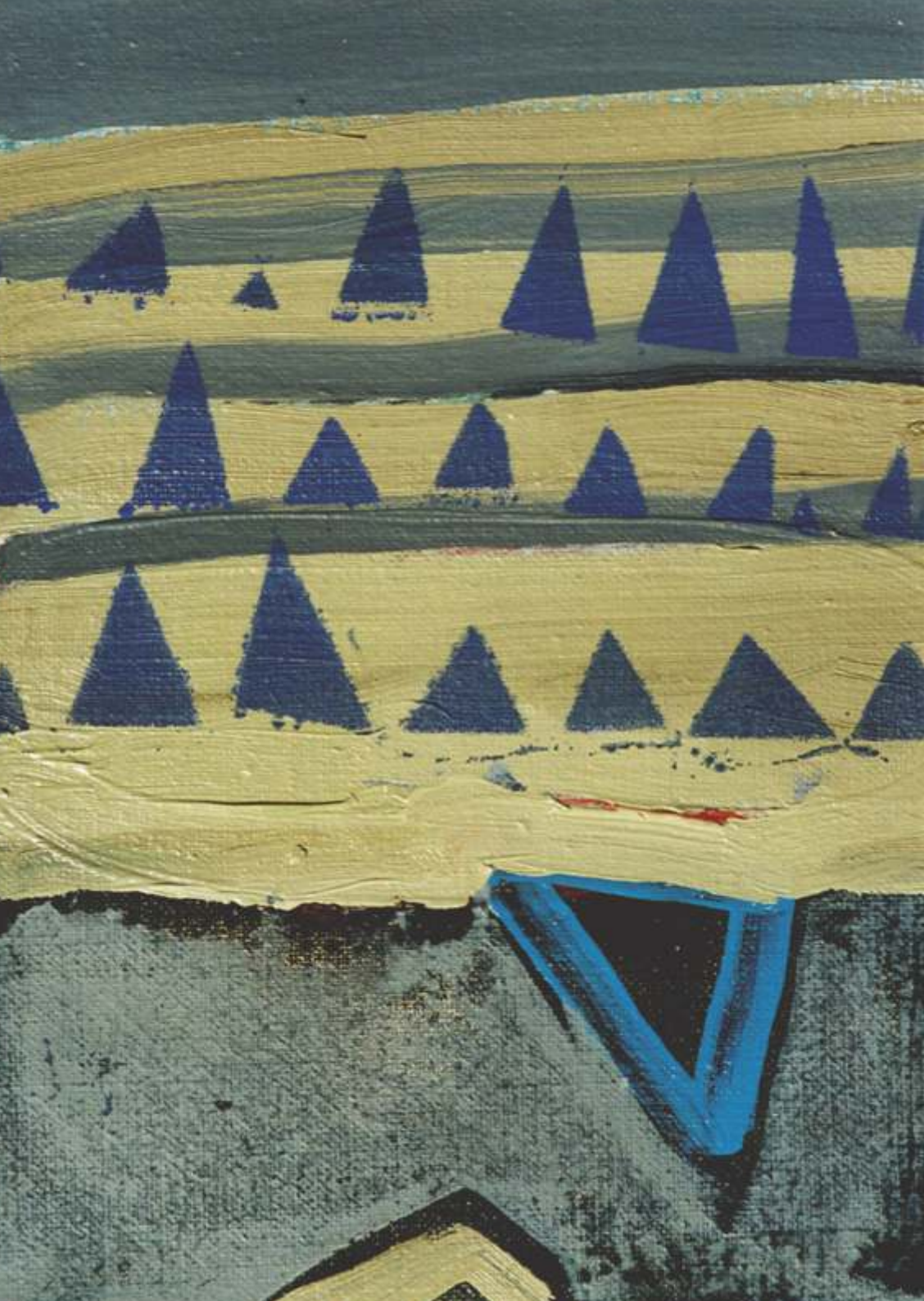
Meksyk, olej, 60 cm x 40 cm