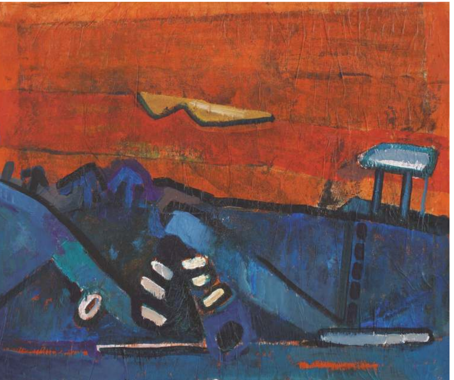
Teotihuacan , olej, 80 cm x 100 cm