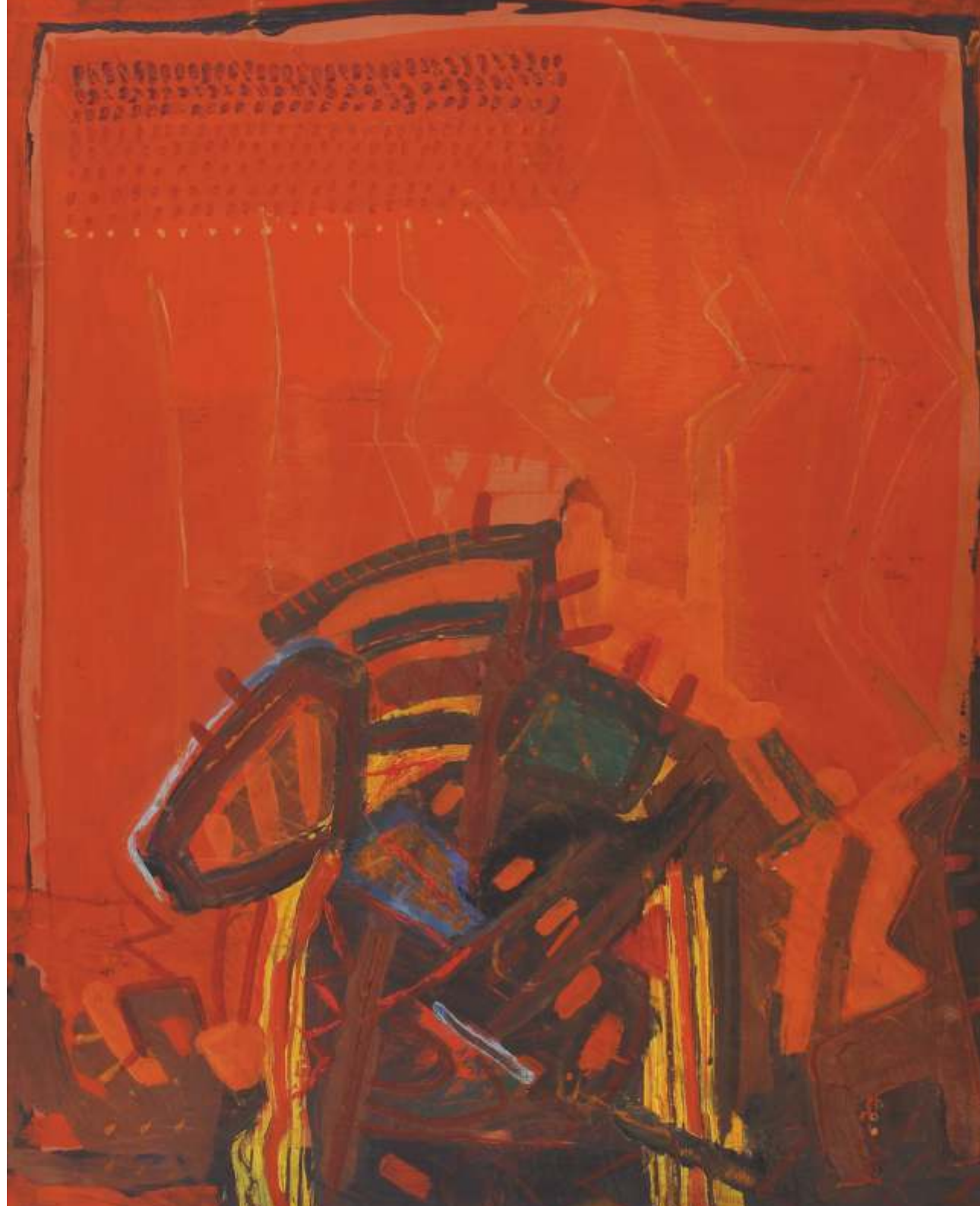
Impresja - Meksyk, olej, 100 cm x 70 cm