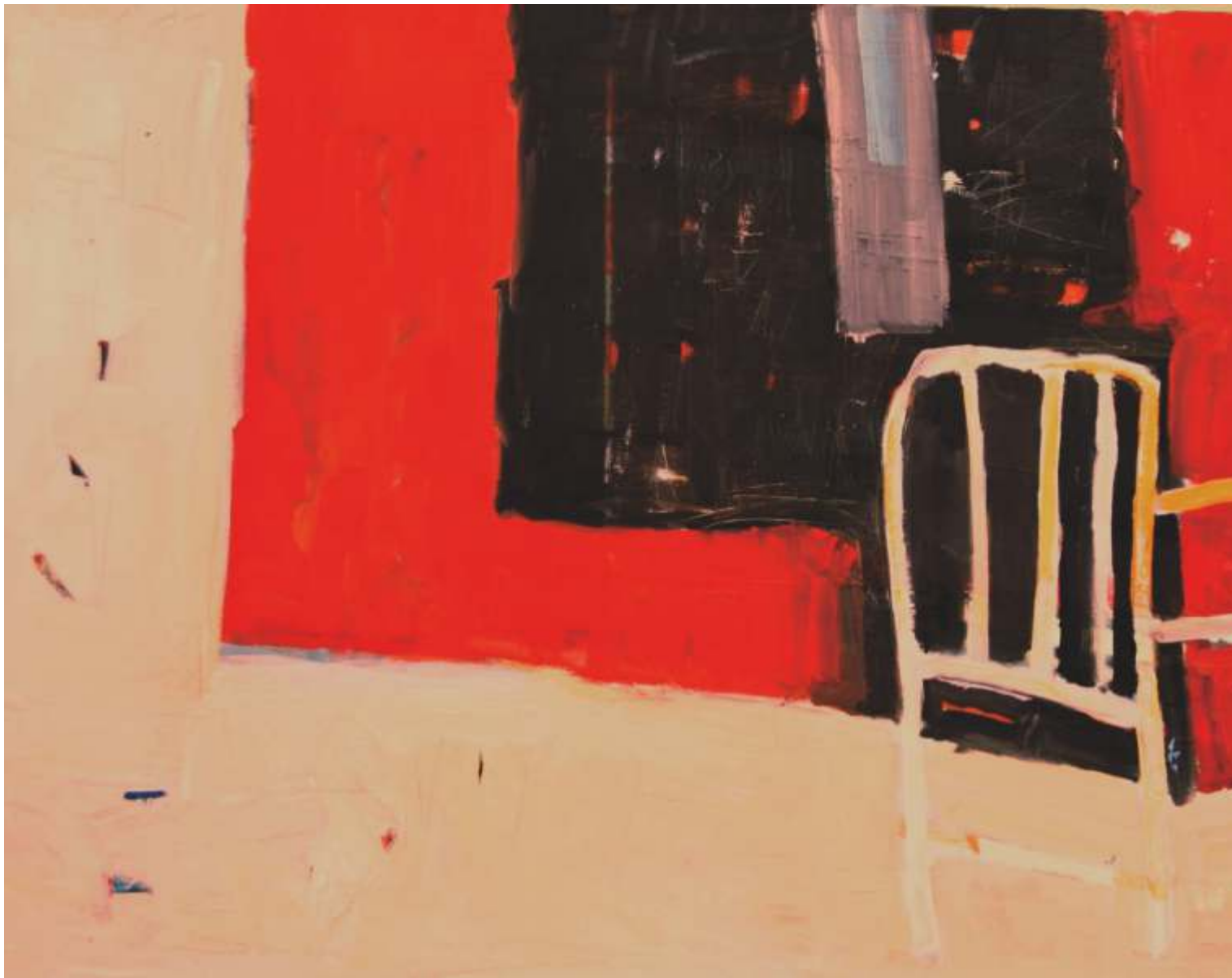
Łó ko , olej, 80 cm x 100 cm