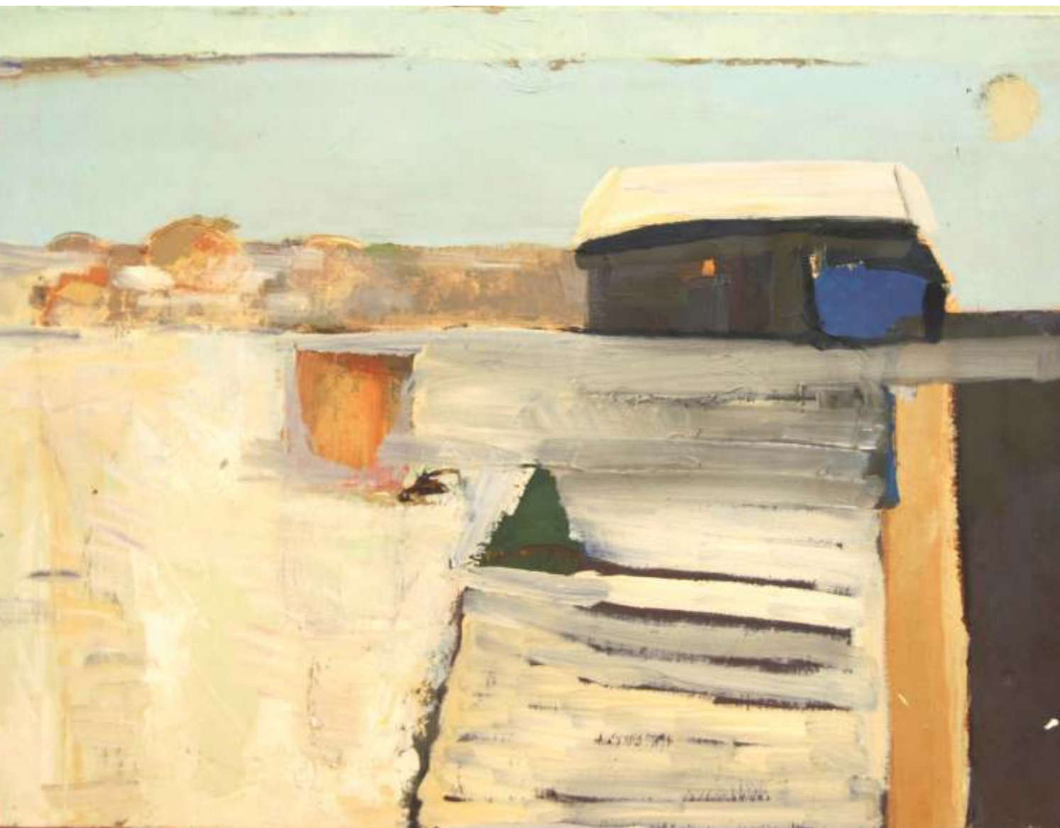
Pejza z Podlasia, olej, 80 cm x 100 cm