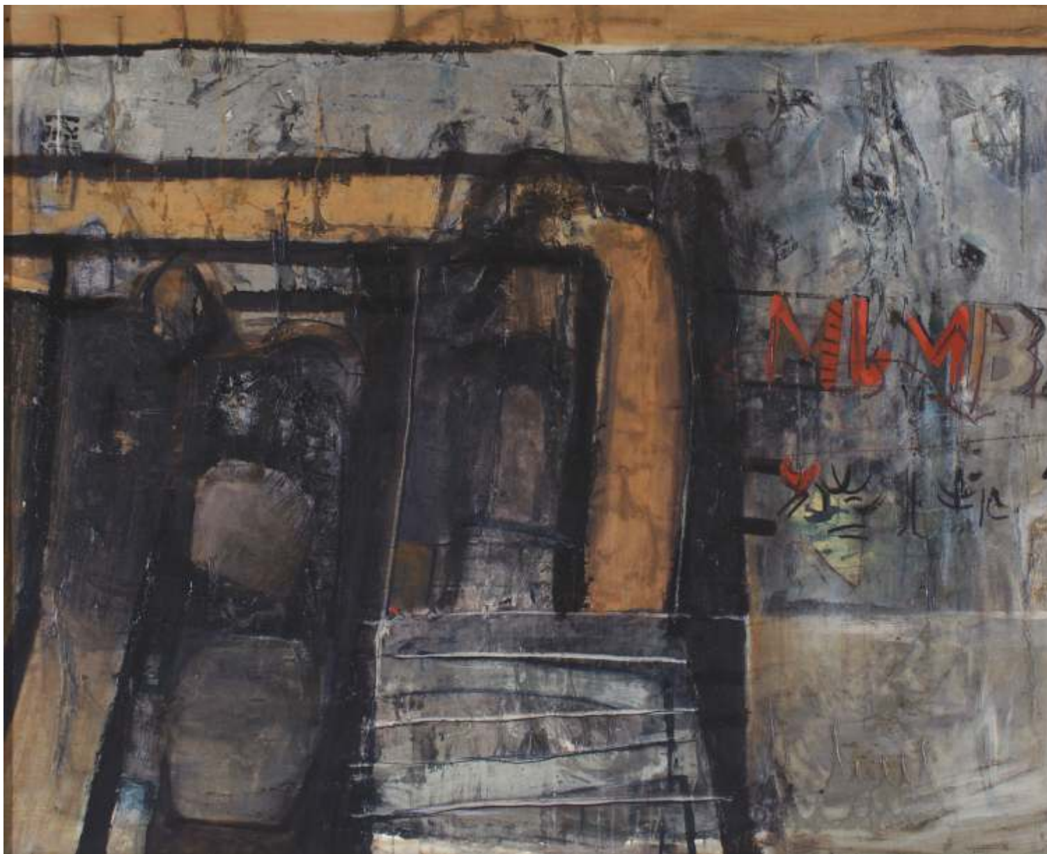
Poci g do Mumbaju, olej, 120 cm x 150 cm