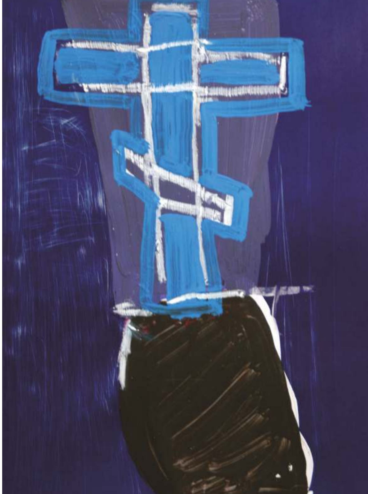
Grabarka, akryl/pastel, 20 cm x 15 cm