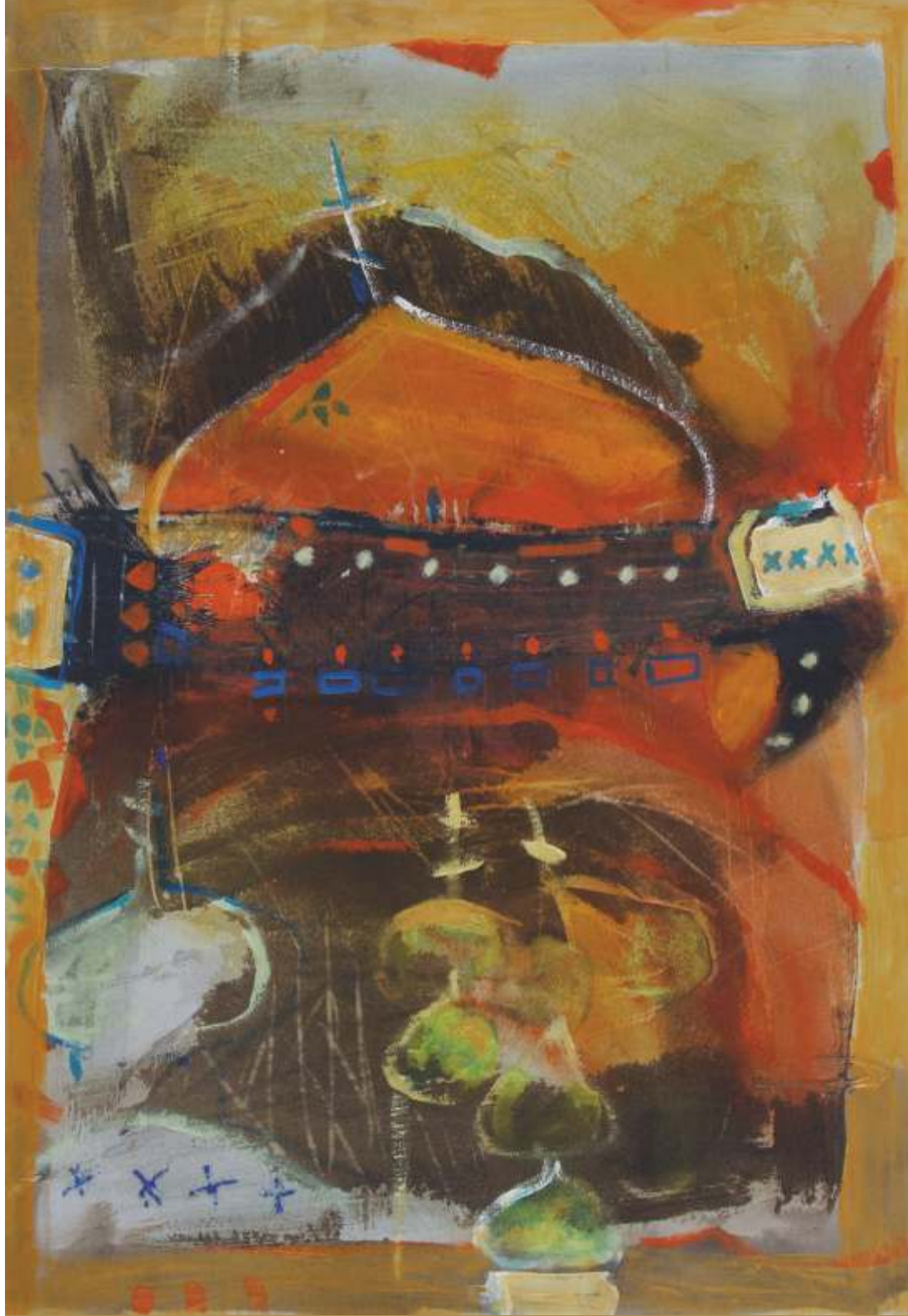
Ławra kijowska, pastel, 100 cm x 70 cm