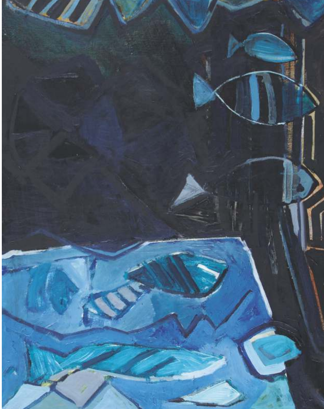
Ryby, olej, 100 cm x 80 cm