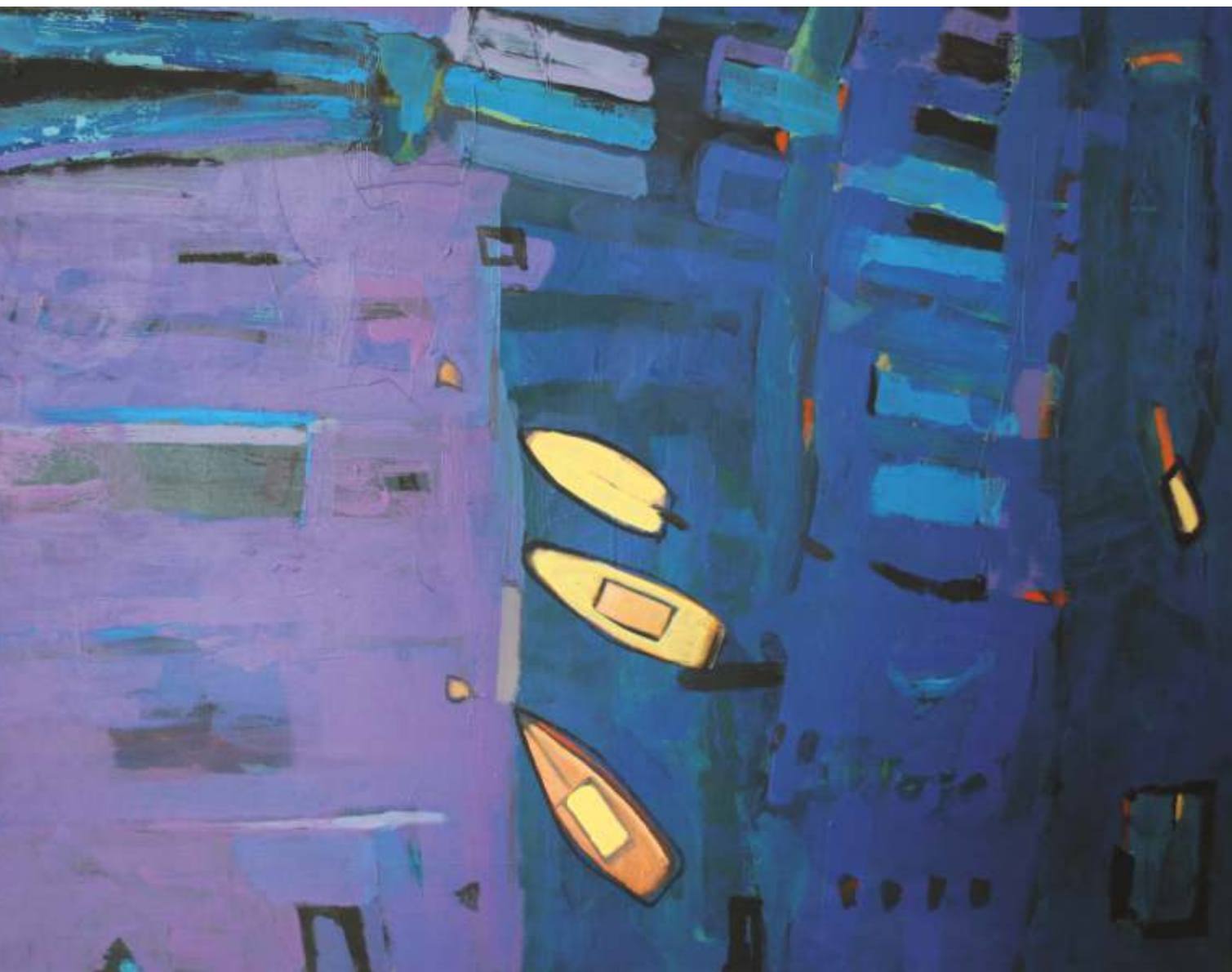
Port , akryl, 90 cm x 70 cm