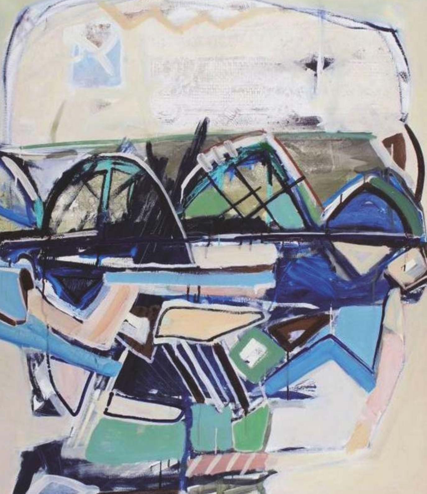
Most na Sanie, olej, 150 cm x 120 cm