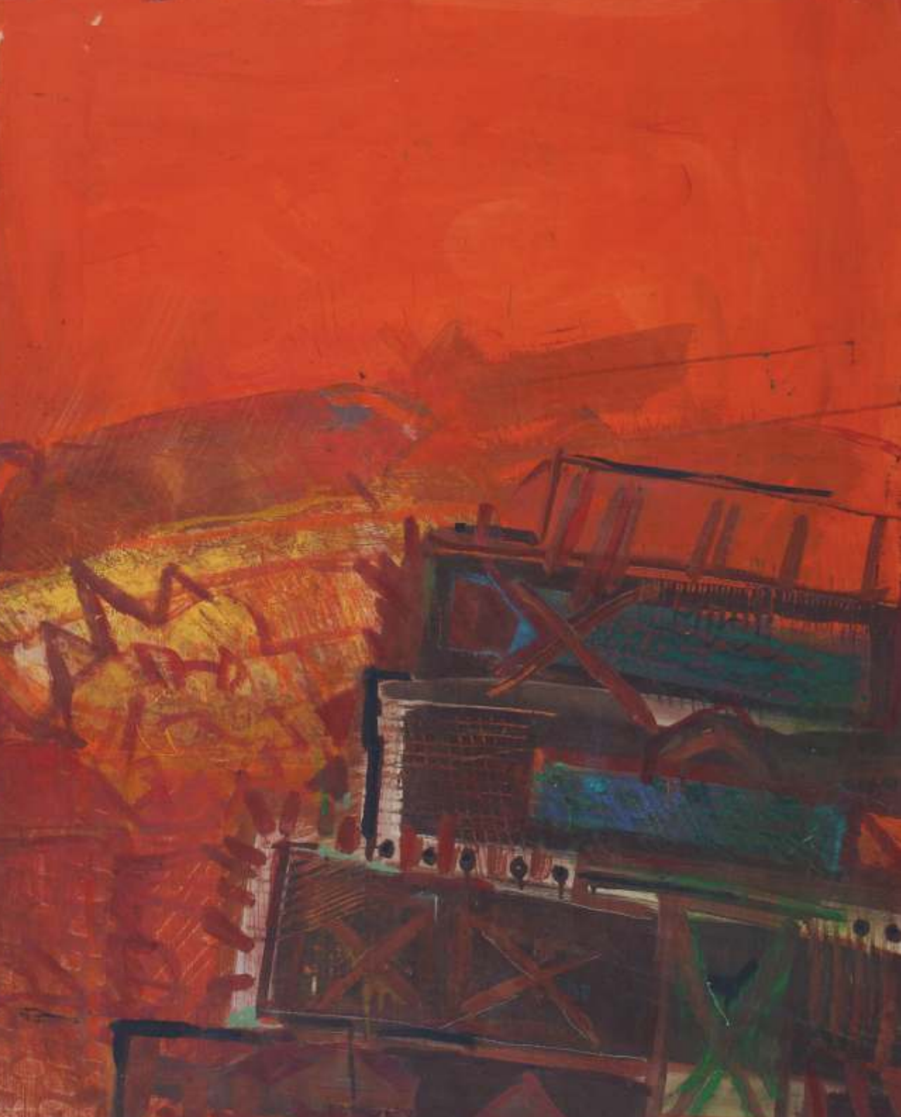
Piramida - Meksyk, olej, 100 cm x 70 cm