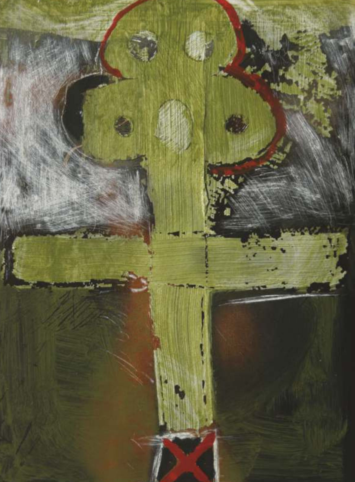
Grabarka I, akryl/pastel, 20 cm x 15 cm