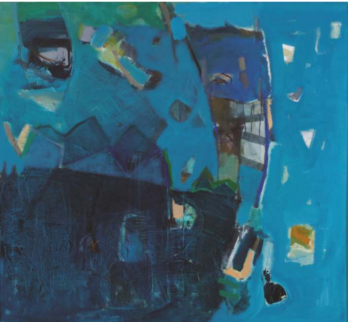
Letni noc , olej, 110 cm x 110 cm