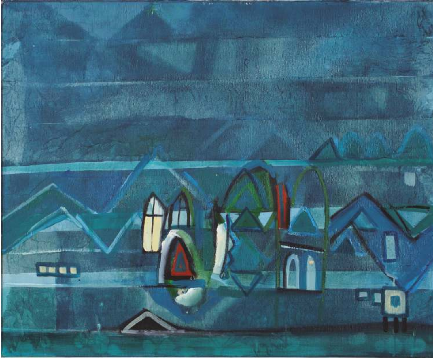
Miasto noc , olej, 80 cm x 100 cm