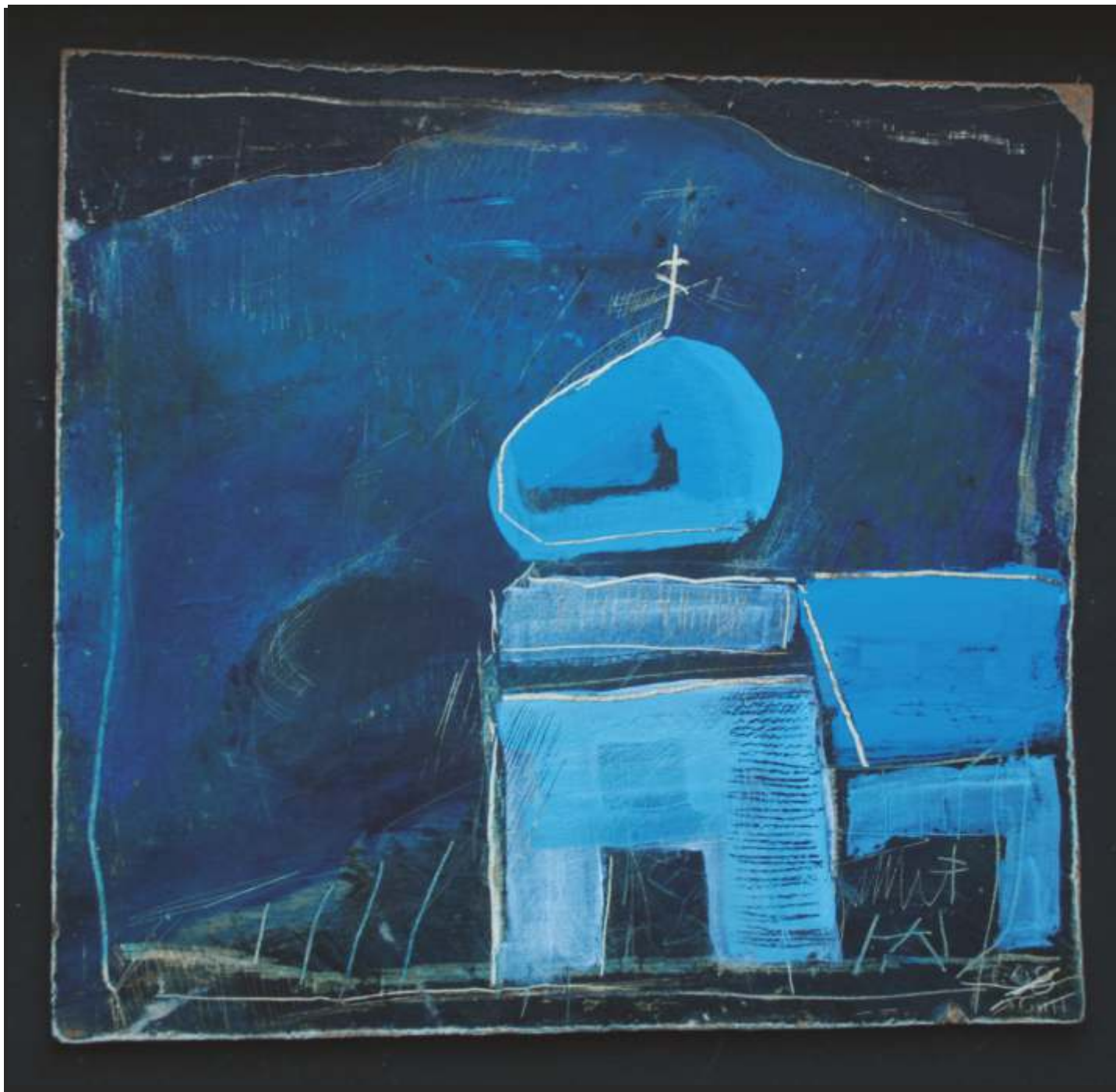
Po słowackiej stronie I, akryl, 15 cm x 15 cm