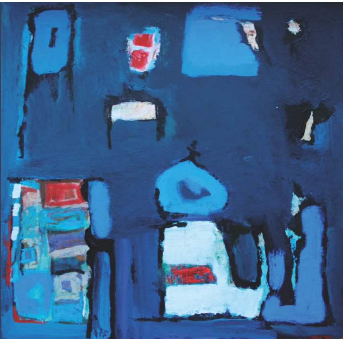
Po słowackiej stronie, akryl, 20 cm x 20 cm