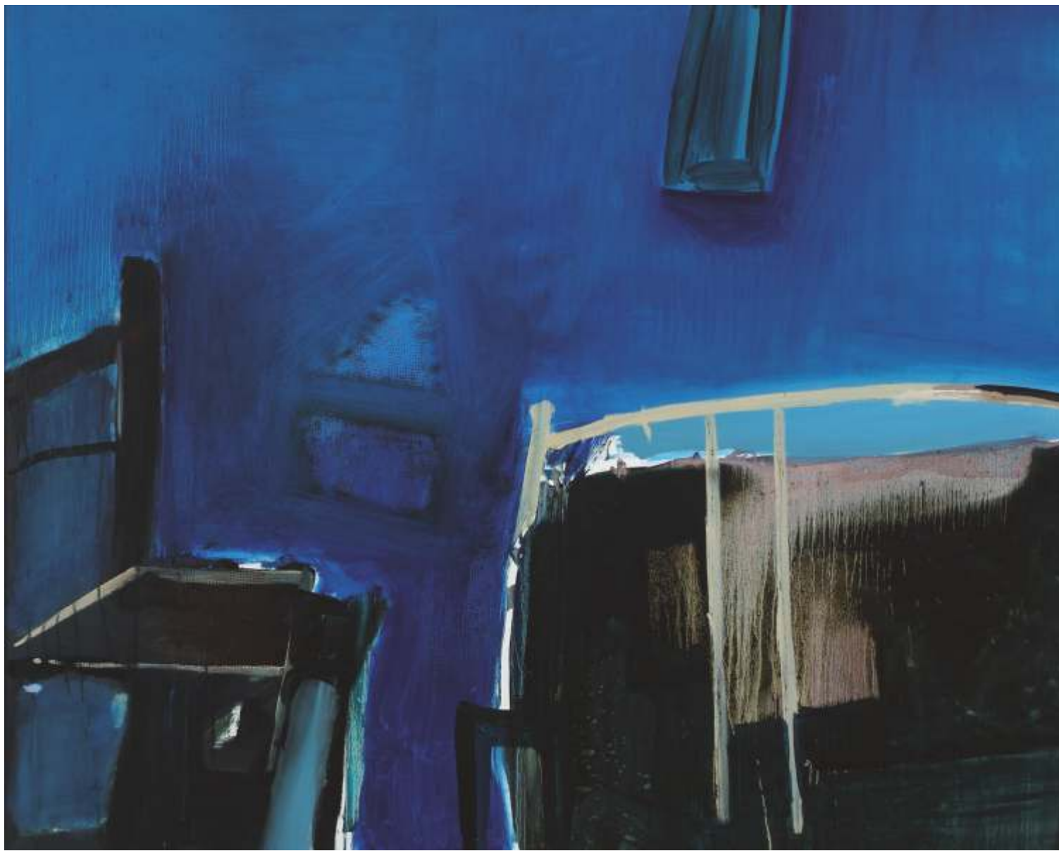
Wn trze, olej, 120 cm x 150 cm