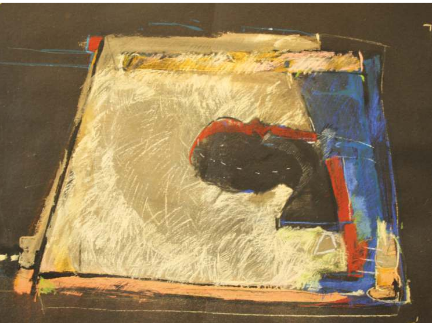
Cie w piaskownicy, pastel, 70 cm x 100 cm