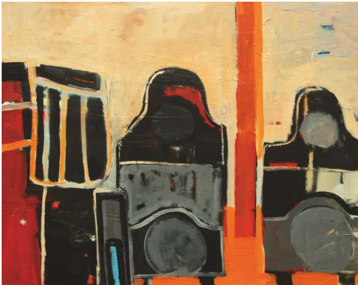
Pokój w Jaworkach, olej, 80 cm x 100 cm