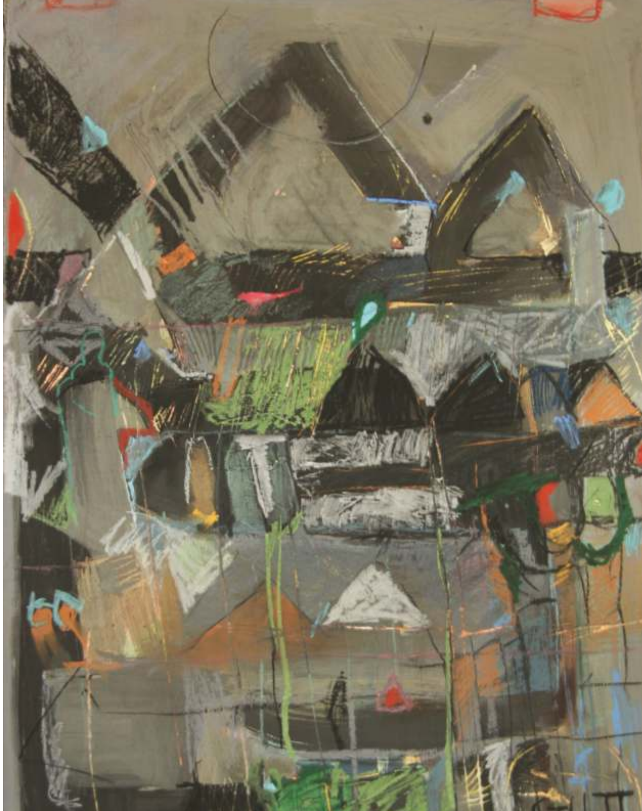
Vera Cruz, pastel, 60 cm x 80 cm