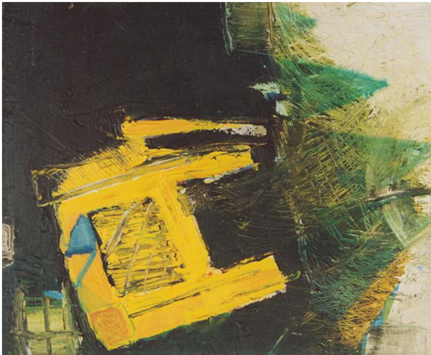
Remont, olej, 60 cm x 80 cm