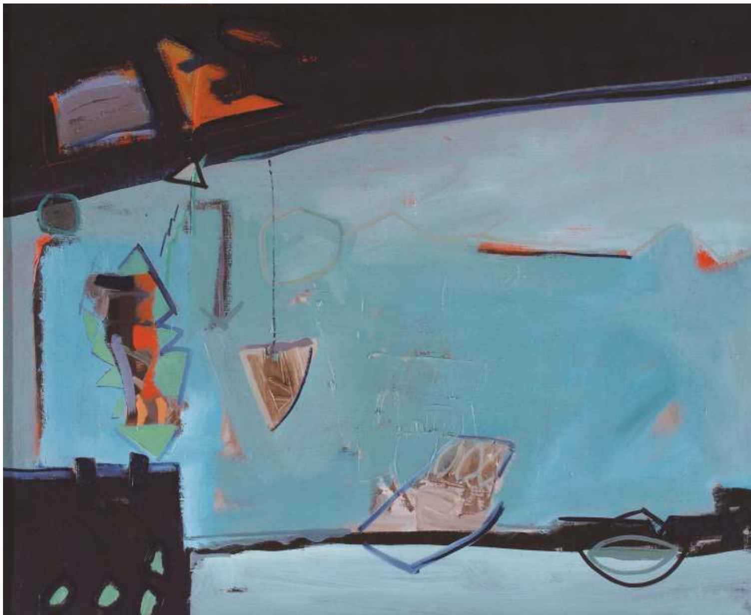
Bez powrotu, olej, 110 cm x 120 cm