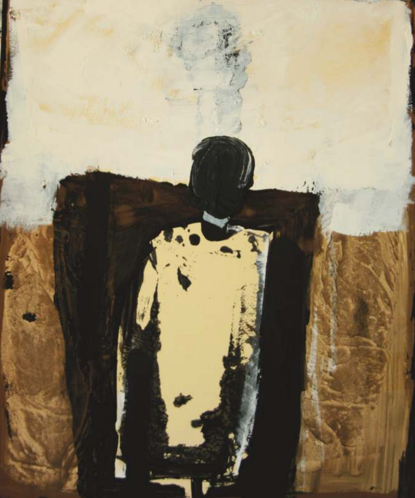
Kuba czyk, akryl, 50 cm x 40 cm