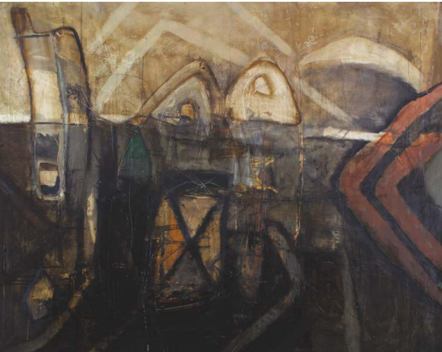
Noc na Goa , olej, 120 cm x 150 cm