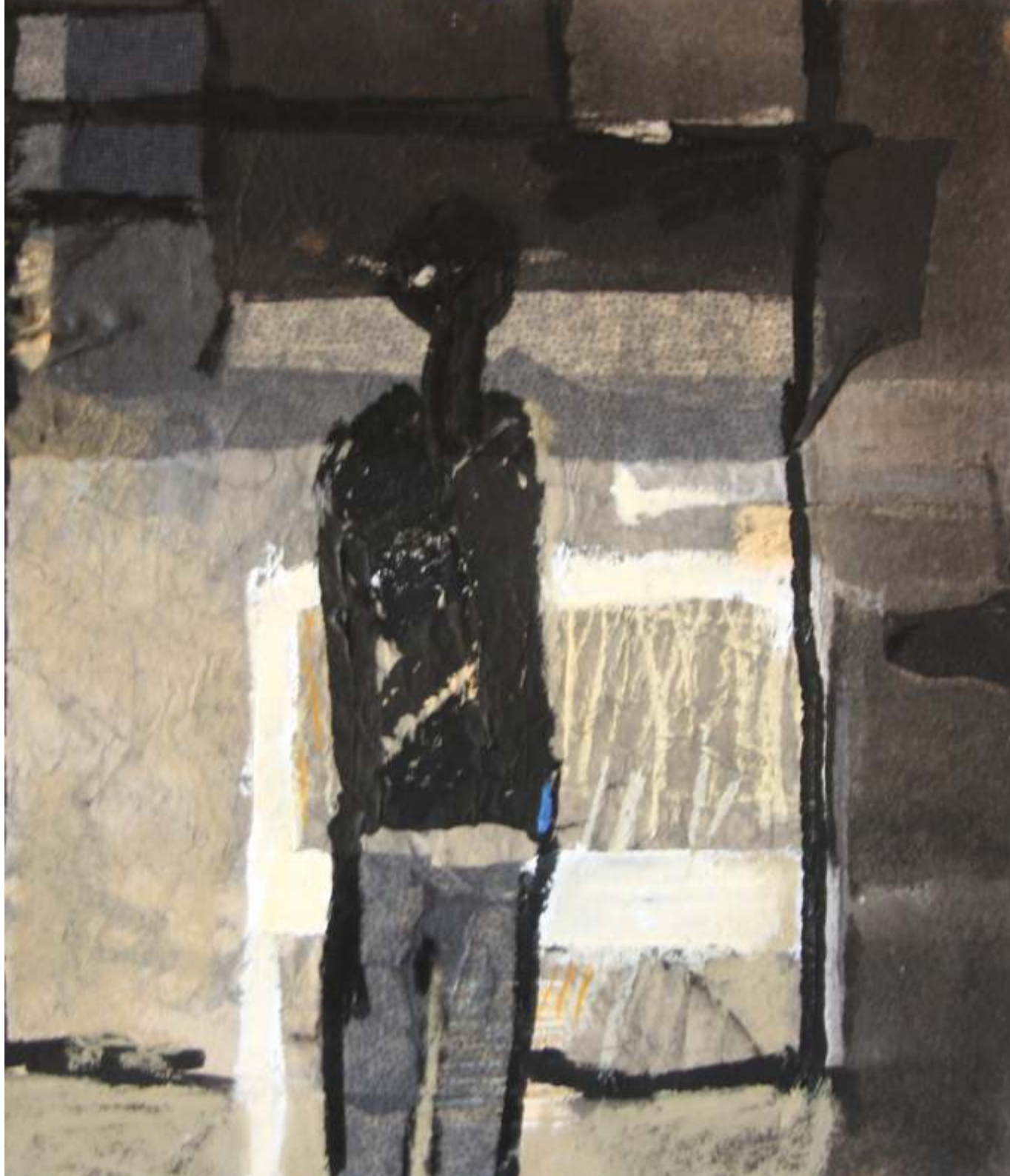
Kuba czyk I, akryl/pastel, 40 cm x 40 cm